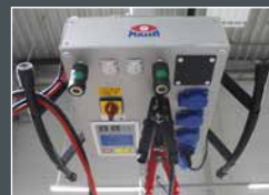
Hebebühnensteuerung, Energieversorgung, Druckluft und Datensteckdose auf der Unterseite platziert.