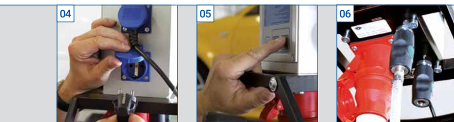
04 Idealer Abstand der Steckdosen für leichte Zugänglichkeit.