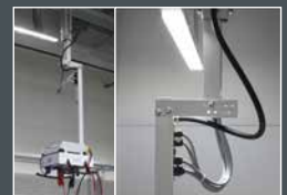
Die Spezialaufhängung mit integrierter Stromführung gewährleistet die gerade Montage der E-BOX.

erterm 5 m-Kabel und CE-Konformitätserklärung ausgeliefert