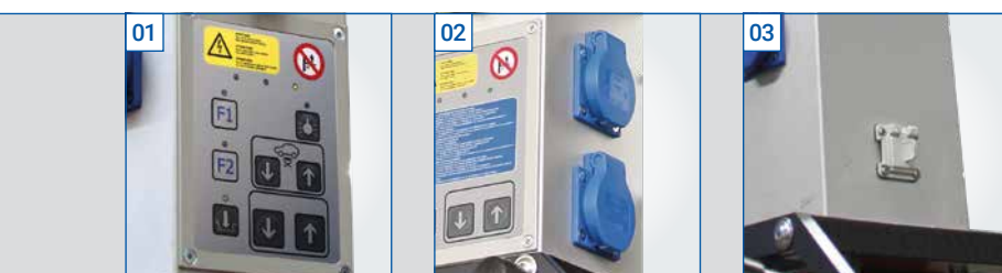
01 Integrierte Hebebühnen-Steuerung (Option)