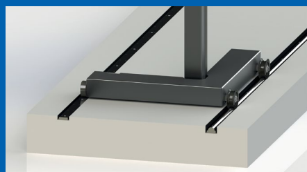
Überfahrbare Achslast: 18 t Nivellierbar

BR380001_007-de.01 · Technische Änderungen vorbehalten! Die Abbildungen enthalten auch Optionen, die nicht zum serienmäßigen Lieferumfang gehören.