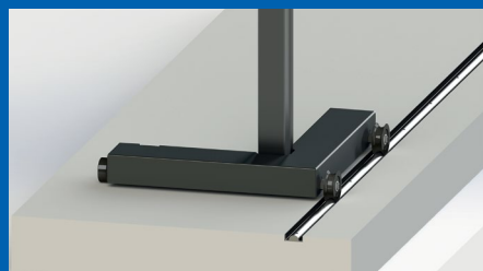
Überfahrbare Achslast: 18 t Nicht nivellierbar