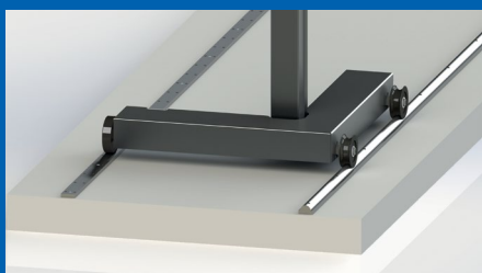
Überfahrbare Achslast: 5 t Nivellierbar

Beim Einsatz eines MLT 3000 mit aktiver Selbstnivellierungsfunktion kann auf eine einzelne Führungsschiene zurückgegriffen werden, wodurch Kosten bei Schienen, deren Installation und turnusmäßiger Nivellierung eingespart werden.